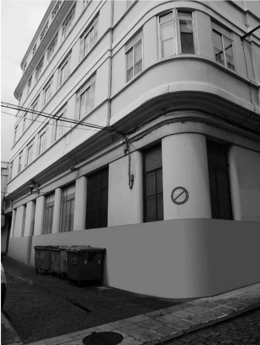
Bajo adquirido para almacén